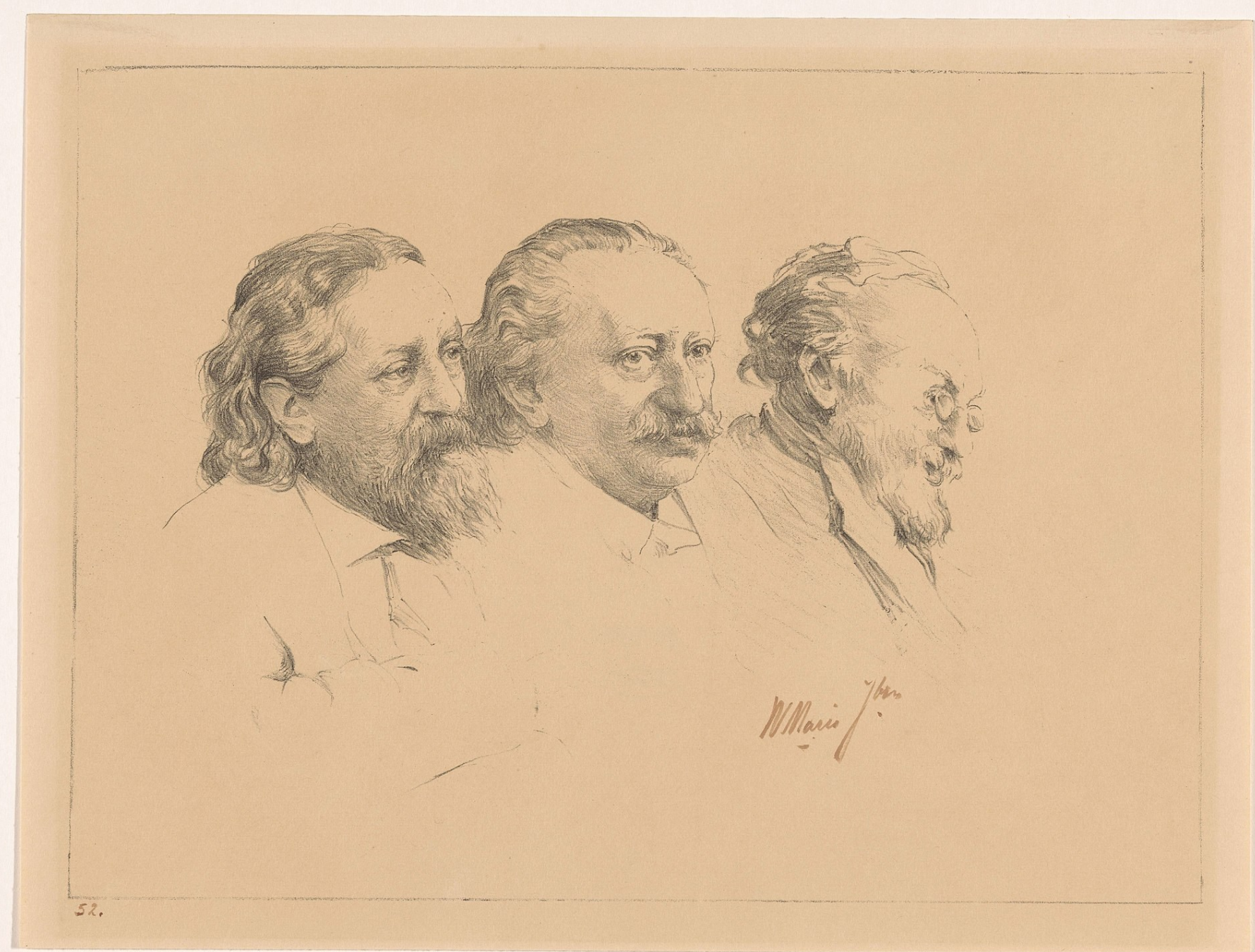
Lithosteen in het Zwol. voor Prapische Techniek, ter Gouwstaat A'dam (aug. 1967)