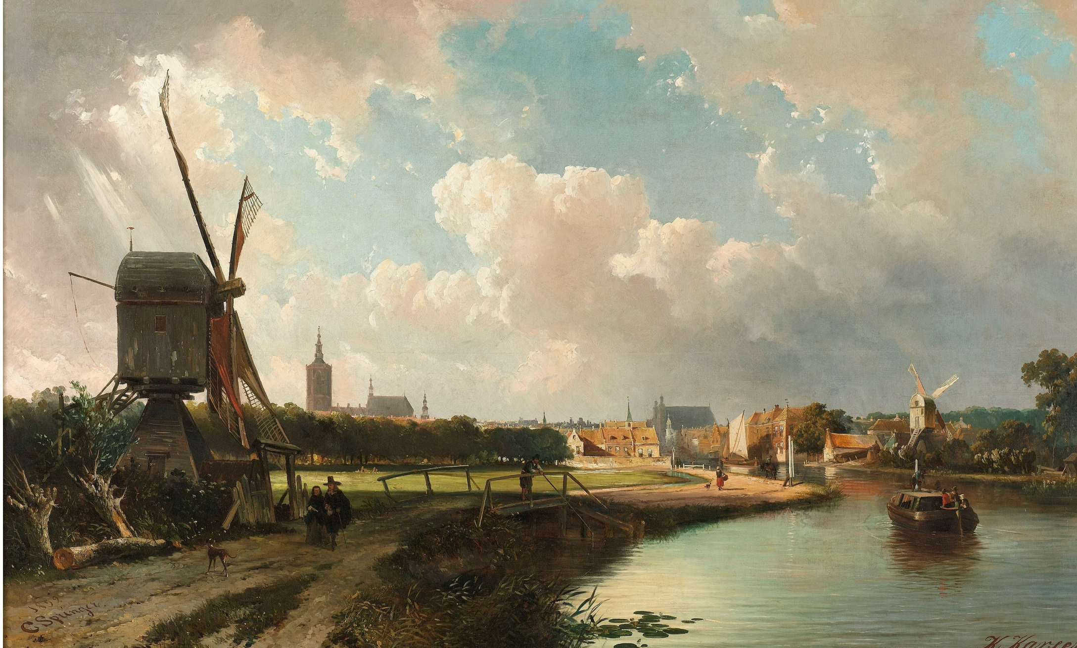
Gezicht op Den Haag vanaf de Delftse vaart in de zeventiende eeuw