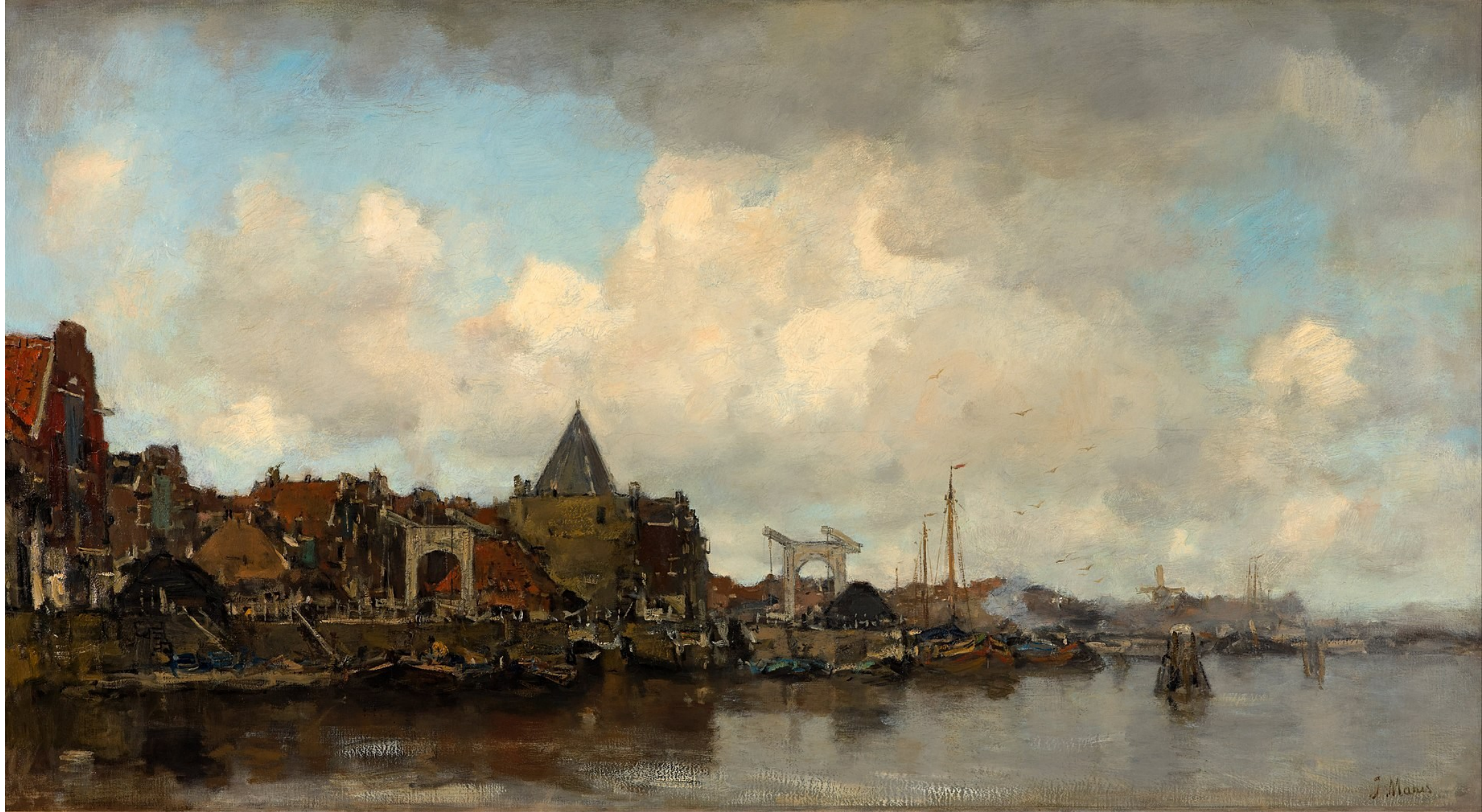
De Schreierstoren circa 1890 Oil on canvas Decorated wood and plaster frame, partially gilded 1,900 mm : 1,220 mm Kunstmuseum Den Haag